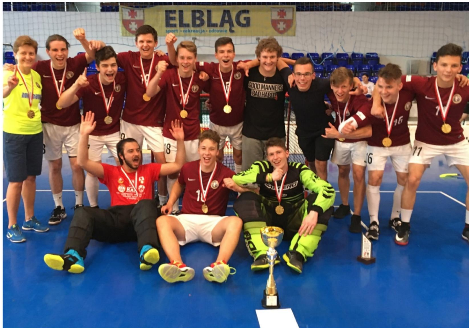
MISTRZ POLSKI LICEALIADY W UNIHOKEJU CHŁOPCÓW