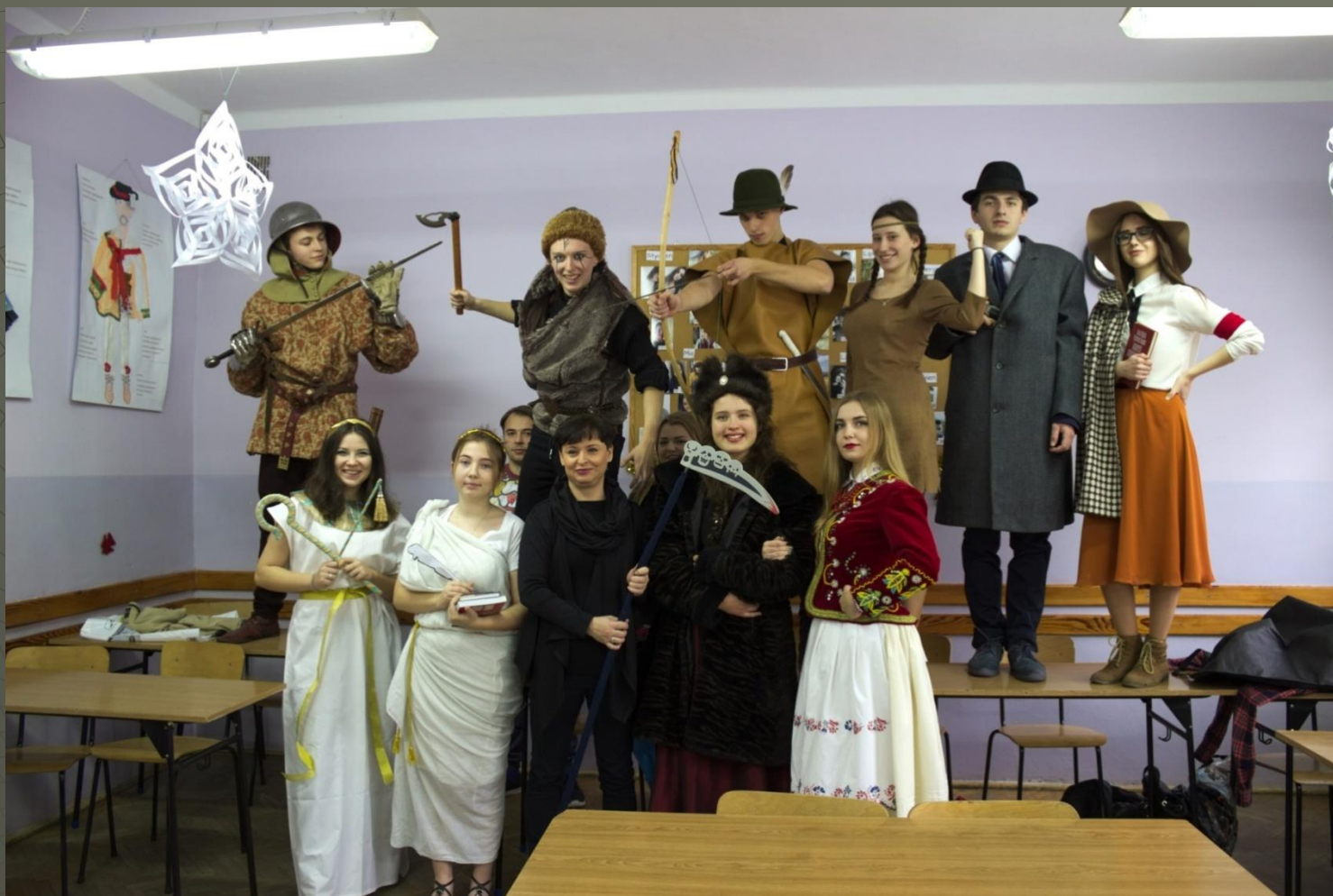
Szkolne koło teatralne